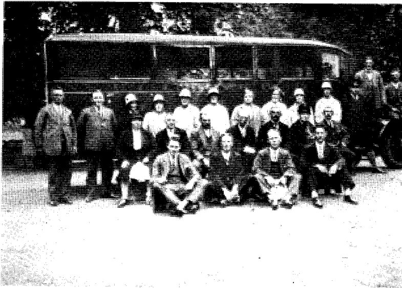
Groep kooplieden op excursie

de koper en als men tot overeenstemming gekomen was, had men echter niet de zekerheid een prijs te ontvangen, die het product op dat moment waard was en evenmin was men zeker van zijn geld. Doch geleidelijk kwam men tot het inzicht, dat een gezamenlijk optreden de voorkeur verdiende: Het organisatiebesef begon wakker te worden.