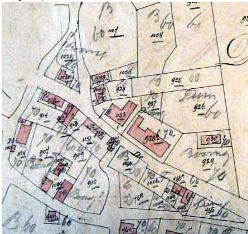
uitsnede uit kadastrakaart sectie B3 van 1887

Wouterus is in 1884 in de bakkerij van Adriaan de Kort komen wonen op C144 (B1088 en B1089)(nu Maaskantje 70).