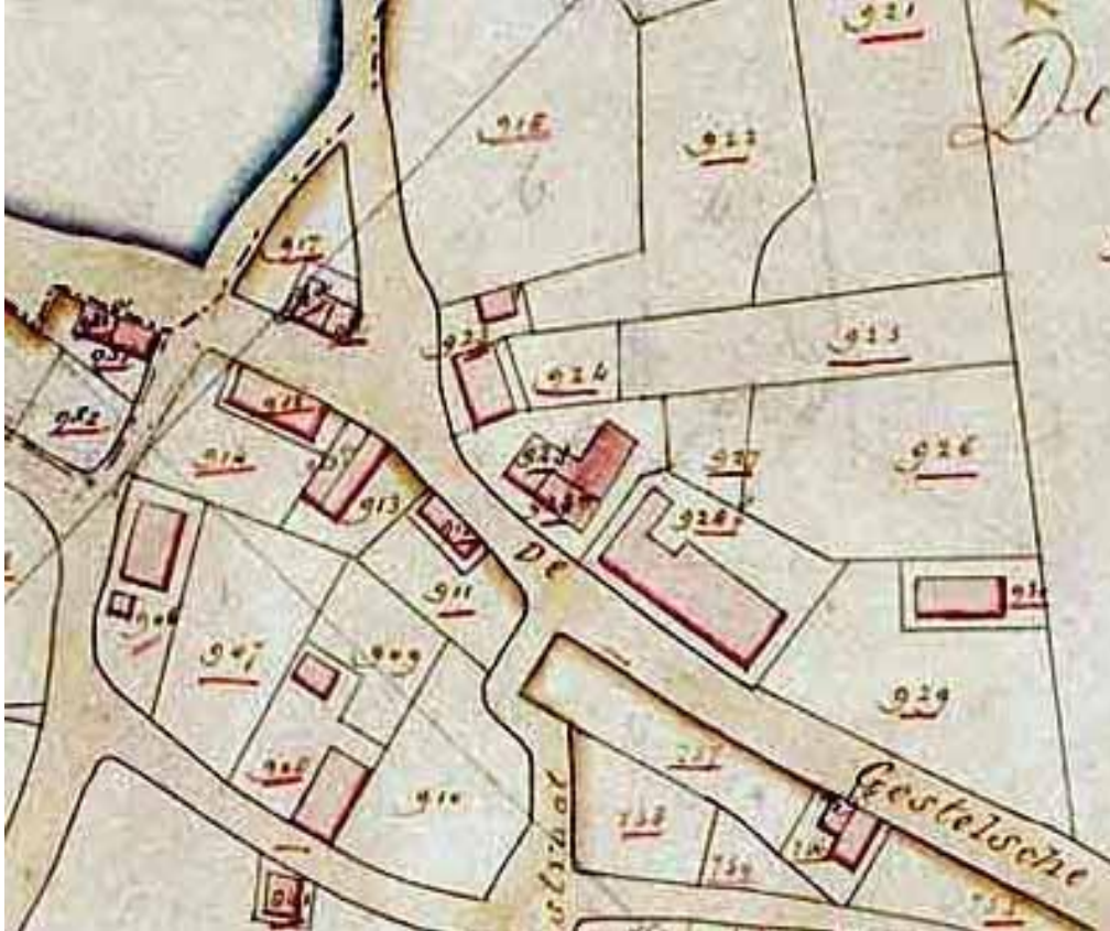
uitsnede uit kadasterkaart sectie B3 van 1832

Voor de ligging van bovengenoemde percelen zie de onderstaande tekening :