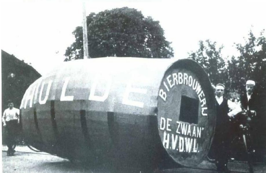
Huub van de Westelaken d'n brouwer staat naast de bierton