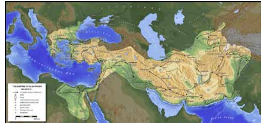
Karte 1: Griechisch-makedonisches Reich zur Zeit von Alexander dem Großen

Es geht hier um die Hauptstadt des letzten antichristlichen Reiches, das weltumfassend sein wird. Es geht um ein Reich in Asien, um das wiederhergestellte Reich von Alexander dem Großen. Das setzte sich praktisch aus der ganzen arabischen Welt zusammen. Alle islamitischen und arabischen Länder des Nahen Ostens gehörten zu diesem Reich. Dies illustrieren auch die folgenden zwei Karten. Die erste ist eine Darstellung des griechischen Reiches zur Zeit von Alexander dem Großen. Die zweite Karte zeigt im Vergleich dazu die arabischen Länder im Mittleren Osten. Es ist auffällig, wie sehr die Gebiete miteinander übereinstimmen.