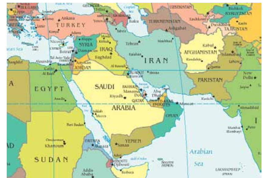
Karte 2: Der Nahe Osten