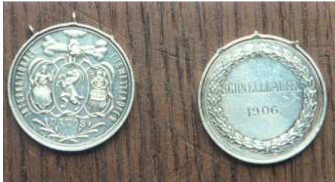
2 medailles van het Europees kampioenschap 1906

Op zondag 28 januari moesten we de 1500 en 10.000 meter rijden. De 500 en 1500 meter lagen mij altijd slecht, maar ze moesten gereden worden. 's Morgens om elf uur werd een aanvang gemaakt met de 1500 meter en hoe ik mij ook inspande, ik werd op deze afstand derde. Eerste Gundersen, tweede Schilling en derde De Koning. Alweer derde en ik was op mijzelf zeer boos. Maar 's middags zou ik de 10.000 meter zo rijden dat de brokken ijs om mijn oren zouden vliegen. Ik moest deze afstand winnen.