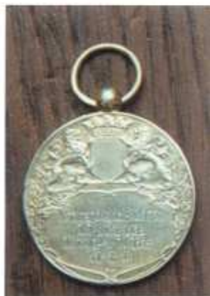
Medailles kampioenschap van Noord-Brabant 1917

Maar het zou nog erger worden. Het bleef er niet bij dat de renners zouden staken als ik meedeed. Ik heb toen ook de prijsuitreiking in Heerenveen meegemaakt en dinsdagmorgen vertrok ik weer naar Leur waar men mij heeft gehuldigd. Dus werd het weer laat. Woensdagmorgen vertrok ik reeds vroeg naar Tilburg voor het kampioenschap van Noord-Brabant. Daar waren ze sportief en hier werd niet gestaakt. Hier won ik het provinciale kampioenschap over drie afstanden en reed ik op de 500 meter een Nederlands record.