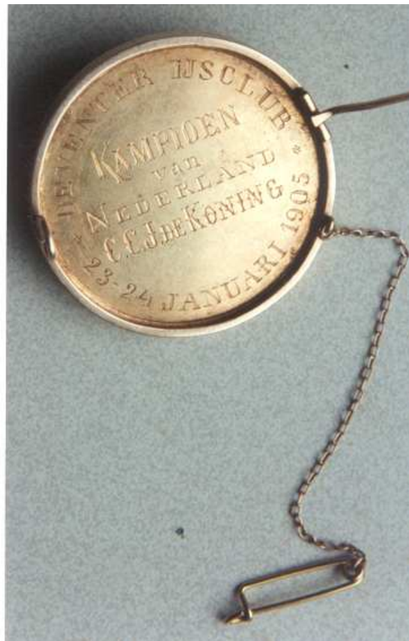
Medaille Nederlands kampioenschap 1905.