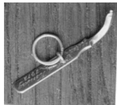
Herinneringsschaatsje eerst aankomende in Sloten