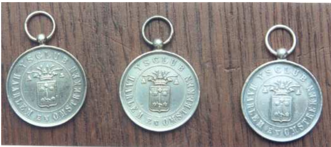
Medailles behaald tijdens het kampioenschap van Noord-Holland in Haarlem. Van links naar rechts: 2 e prijs 500 meter, 2 e prijs 1500 meter en 2 e prijs 3000 meter.

voorop en bij de derde ronde had ik van mijn achterstand veel ingelopen. In de vierde ronde was ik weer dicht bij Jan gekomen en in de laatste ronde reed ik naast hem. Dat was niet naar mijn zin. Ik wilde onder geen beding Jan voorbijgaan, dus bleef ik iets achter. Het begon bedenkelijk te worden en ik hitste hem op: "Toe Jan, vooruit, Jan, vooruit!" Maar Jan reageerde er niet op en bij het uitgaan van de laatste bocht was ik wat vóórgelopen en toen schreeuwde ik Jan toe: "Vooruit, vooruit." Ik liet mij uitlopen want onder geen voorwaarde wilde ik vóór hem de eindstreep passeren. Jan werd één en ik tweede in deze rit met een verschil van anderhalve meter. Hierna moesten nog drie paren deze afstand rijden, dus ik had tijd om mijn boord, vest en jas aan te trekken en mijn broekspijpen weer omlaag te doen. Mijn schaatsen heb ik toen afgedroogd, mijn leren sokken in mijn koffertje gepakt en klaar was ik. Ook Jan had zijn schaatsen uitgedaan, alsmede zijn tricot broek en shirt en ook hij was weer de oude. Hij ging toen weer naar de andere rijders kijken en toen deze ook klaar waren, kwam Jan weer naar mij toe en vertelde mij dat ik weer tweede was.