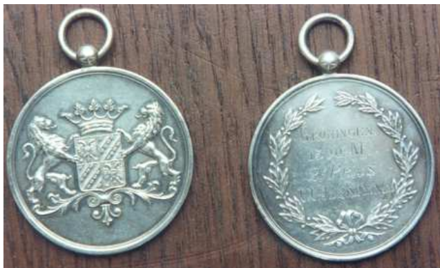
Medaille 2 e plaats 1500 meter. Groningen, 8 december 1902