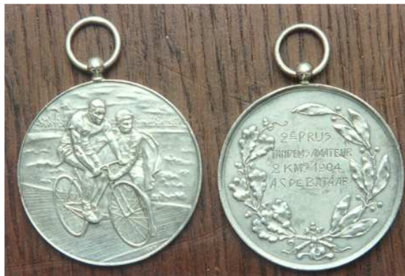
Medaille 2e prijs tandems uit 1904

Daarna is hij gestopt met de deelname aan fietwedstrijden. Maar hij heeft de wielersport nooit helemaal kunnen loslaten.