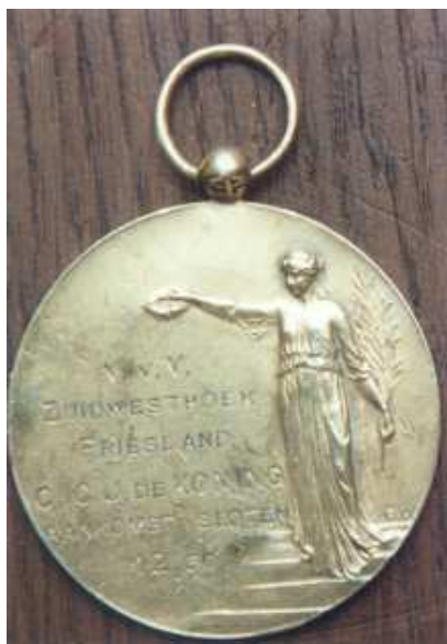
medaille voor de eerst- aankomende in Sloten 1917

Toen we in Balk aankwamen, legde de gids uit hoe ik nu moest rijden om in Sloten te komen. Hij ging niet mee, want het stuk van de Galamadammerbrug tot Balk was wat te hard gegaan en hij was erg moe. Ik ging maar alleen op weg naar Sloten over het Slotermeer. Gelukkig reed op grote afstand van mij een rijder die volgens mijn gids naar Sloten ging en dat was zo.