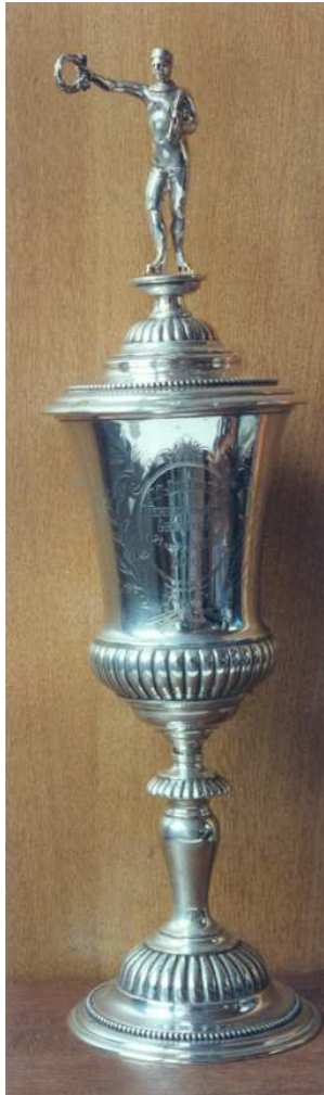
Beker van het wereldkampioenschap 1905.