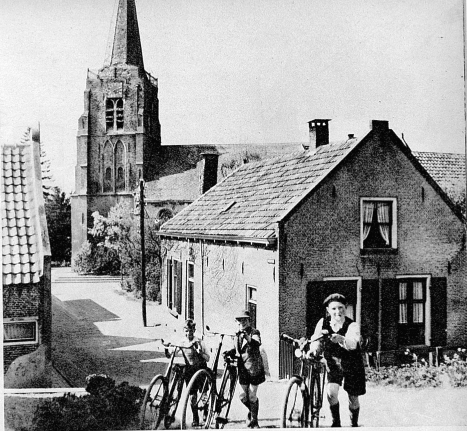
Aan de voet van de dijk staan de kleine huizen. Daarachter torent de spits van de Hervormde kerk van Jaarsveld omhoog, een historisch monument, dat binnenkort gerestaureerd zal worden.

kantoren buiten Lopik; bijvoorbeeld naar de scheepswerven van Lekkerkerk, de zilverfabrieken in Schoonhoven en naar de Zuiderzeewerken.