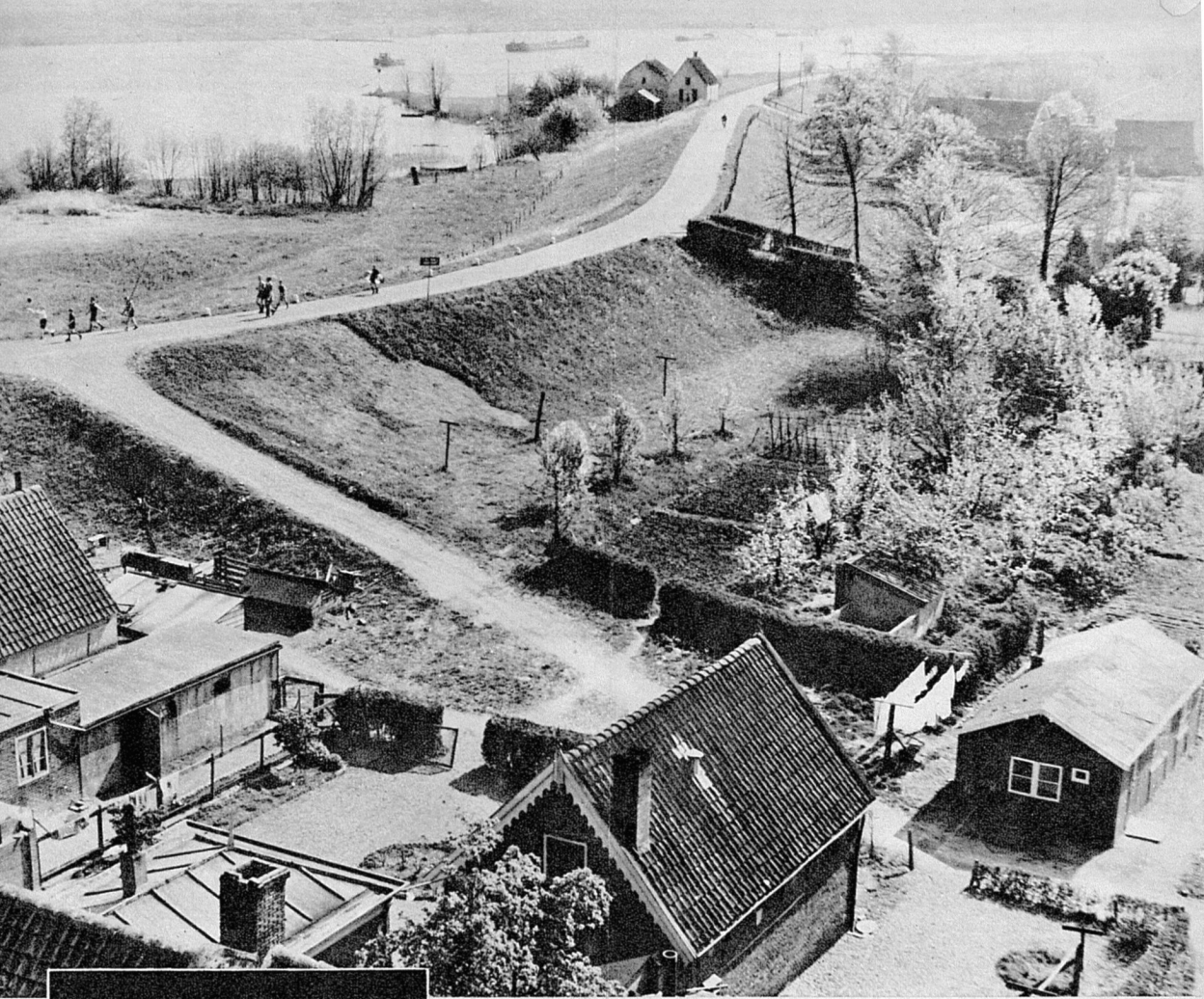
De kronkelende Lekdijk bij Jaarsveld, de verbinding tussen Jaarsveld en Schoonhoven.