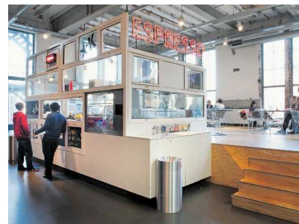
BK City van de TU in Delft geldt als voorbeeld voor de manier waarop universiteiten van cultureel erfgoed levendige ontmoetingsplaatsen voor studenten en onderzoekers kunnen maken. Een gebouw waarin geleerden zich niet meer terugtrekken in hun studeerkamers, maar waarin studenten, docenten en onderzoekers elkaar in zoveel mogelijk open ruimten ontmoeten.